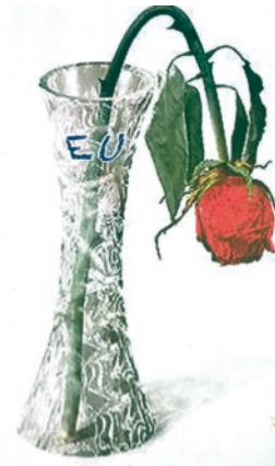
Der Niedergang der SPÖ

so wie der Kiosk. Die KPÖ tritt dafür ein die Situation baulich so zu belassen wie sie ist und am östlichen Rand, neben den Fahrradabstellplätzen, einige gebührenfreie Kurzparkplätze (ca. 15 Minuten) einzurichten, um ein legales, kurzes Zufahren zur Bank und den Geschäften zu ermöglichen. Derzeit wird hier meist illegal gehalten.