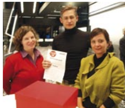
Anti-Privilegierte Partei: KPÖ für mehr soziale Gerechtigkeit

Klimt-Weithaler bekräftigt auch die Forderung nach einer Wahlkampfkostenbeschränkung, für die die KPÖ auch im Landtag geworben hat. Das würde den Menschen mehr bringen als die Verschiebung von Parteivermögen von einem Finanzkonstrukt in ein anderes.