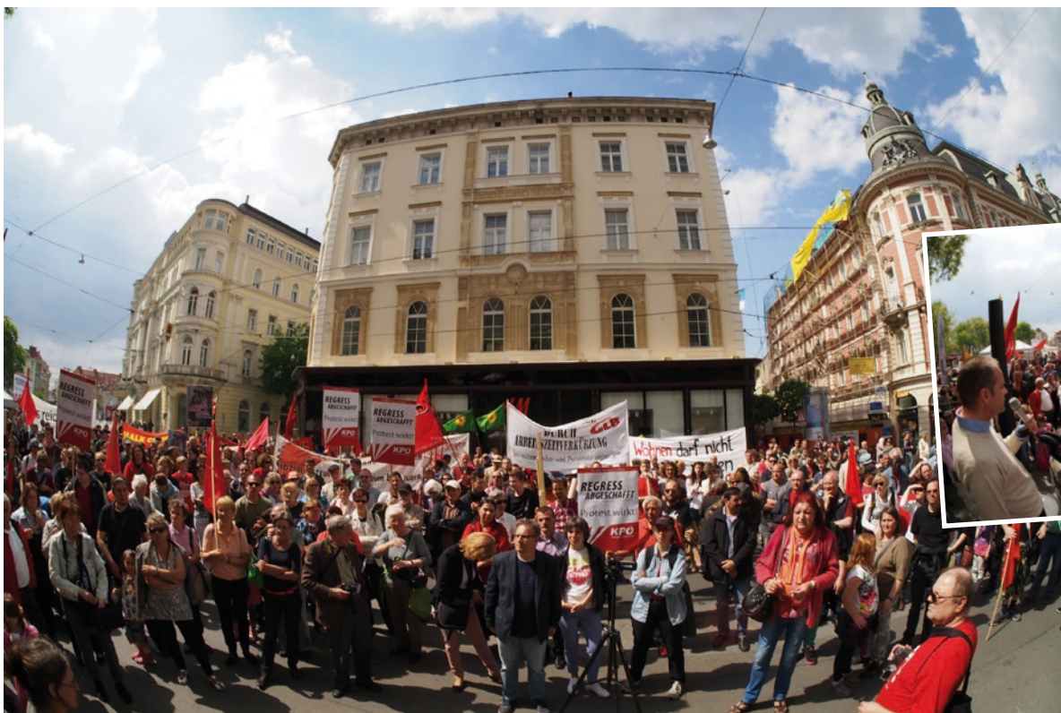
Hunderte Menschen bei der Schlußkundgebung der KPÖ-Steiermark.

Österreich jenseits der EU ist die notwendige Voraussetzung dafür, daß die arbeitenden Menschen in unserem Land von der Defensive wieder in die Offensive kommen.“