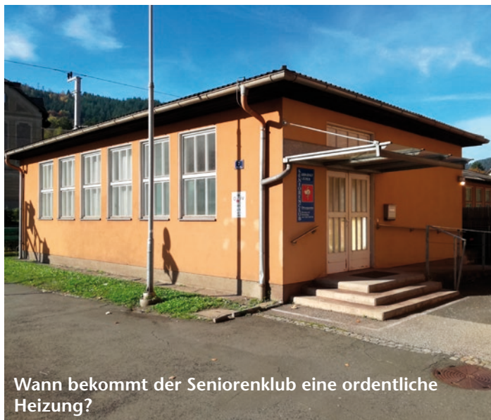
Wann bekommt der Seniorenklub eine ordentliche Heizung?

Zebrastreifen im Ortsteil Donawitz. In der Pestalozzistraße auf Höhe des Pflegeheimes Steinkellner - hier hat es bereits eine Fußgängerzählung gegeben, auf die Auswertung wird noch gewartet - und bei der Unterführung in der Kerpelystraße. Die Unterführung