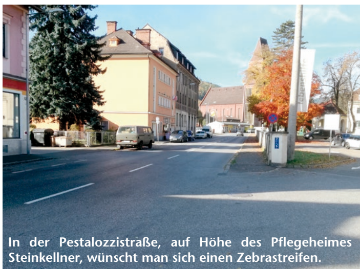
In der Pestalozzistraße, auf Höhe des Pflegeheimes Steinkellner, wünscht man sich einen Zebrastreifen.

renklub Donawitz. Die Senioren erwarten sich mehr Veranstaltungen und in der kalten Jahreszeit ordentlich geheizte Räume.