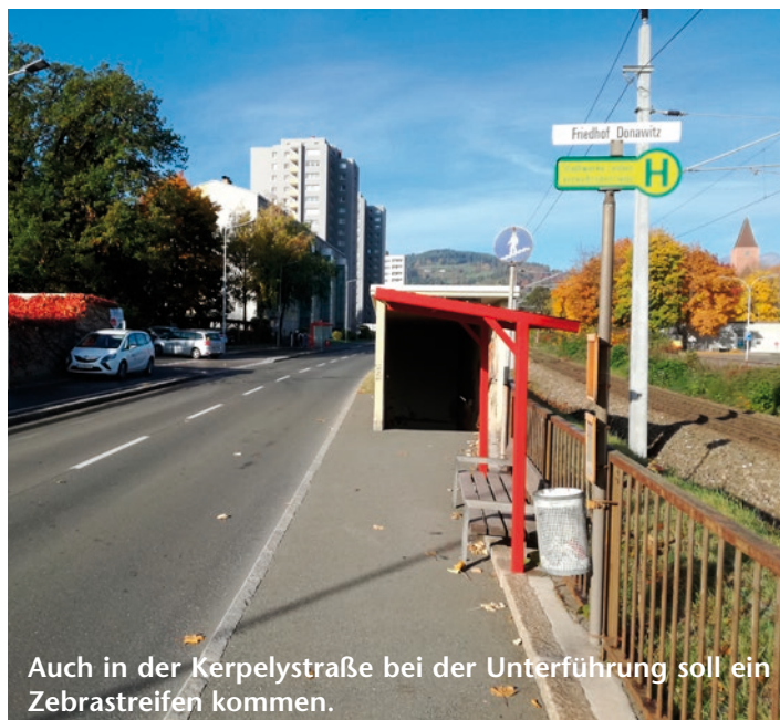
Auch in der Kerpelystraße bei der Unterführung soll ein Zebrastreifen kommen.

und die Polizeimusik wünschen sich eine längerfristige Perspektive betreffend ihrer Heimstatt.