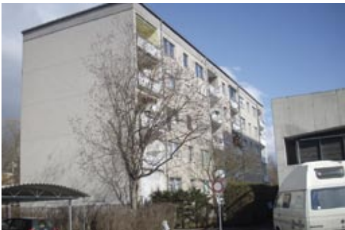
Franz Nabelweg in Kapfenberg . Ca 56 m 2 , Wohnzimmer, Schlafzimmer, Küche. VB € 42.000.-