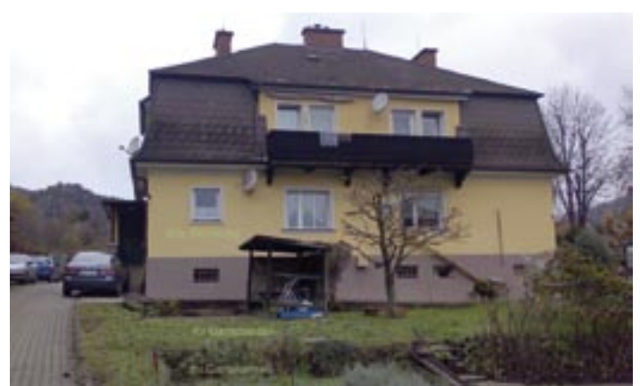
Leoben Top Donawitzlage, Eigentumswohnung ca 54 m 2 mit Garage und Garten, KP € 42.000.-

WEITERE OBJEKTE: http://www.stengg-invest.at