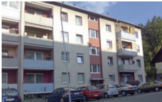
Niklasdorf Bergstraße 3.Stock. Ca 65 m 2 , Wohnzimmer, Schlafzimmer, Küche mit Einrichtung. VB € 60.000.-