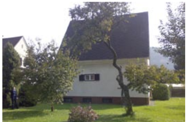
Trofaiach Flurgasse 4 . Ca 100 m 2 Wohnfläche, ca 897 m 2 Grund. Ferngas Zentralheizung, VB € 100.000.-