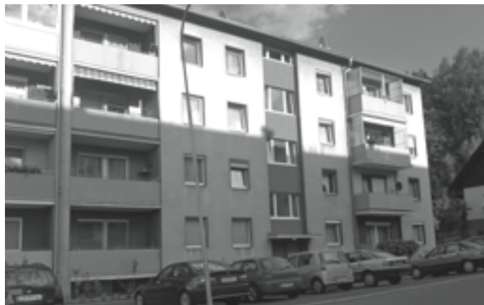
Niklasdorf Bergstraße 3.Stock. Ca 65 m 2 , Wohnzimmer, Schlafzimmer, Küche mit Einrichtung. VB € 60.000.-