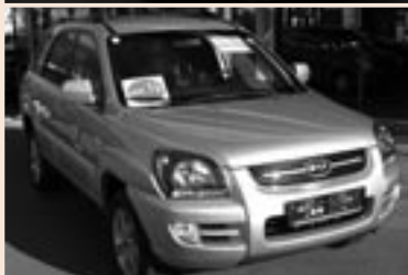
Kia Sportage Allrad 2,0 Diesel. Listenpreis € 27.890,- Aktionspreis € 23.990,-