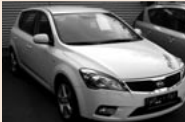
Kia Ceed 5türlich 1,4 Benzin. Listenpreis € 17.790,- Aktionspreis € 15.790,-