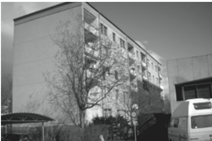
Franz Nabelweg in Kapfenberg . Ca 56 m 2 , Wohnzimmer, Schlafzimmer, Küche. VB € 42.000.-