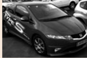
Honda Civic Type S 1,4 Benzin. Listenpreis € 22.100,- Aktionspreis € 18.900,-