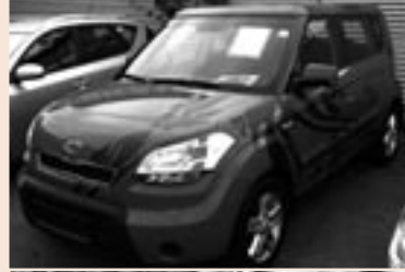
Kia Soul 1,6 Diesel. Listenpreis € 18.490,- Aktionspreis € 16.790,-