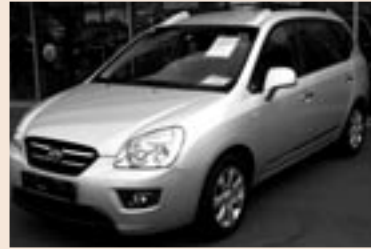
Kia Carens 2,0 Diesel. 115 PS. Listenpreis € 24.190,- Aktionspreis € 21.490,-