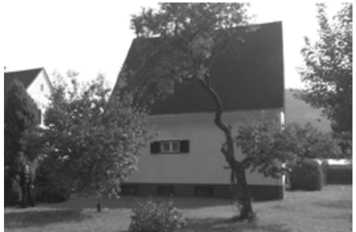
Trofaiach Flurgasse 4 . Ca 100 m 2 Wohnfläche, ca 897 m 2 Grund. Ferngas Zentralheizung, VB € 100.000.-