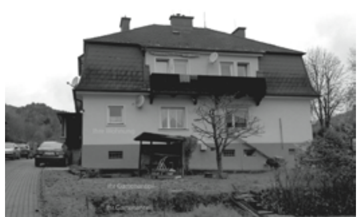
Leoben Top Donawitzlage, Eigentumswohnung ca 54 m 2 mit Garage und Garten, KP € 42.000.-

WEITERE OBJEKTE: http://www.stengg-invest.at