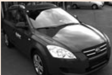
Kia Ceed SW 1,6 Diesel. 90 PS. Listenpreis € 18.690,- Aktionspreis € 16.990,-