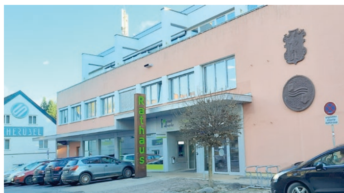
Ab Jänner gibt es im Gemeindeamt eine kostenlose Energieberatung.

Impressum: Medieninhaber, Verleger, Herausgeber: Verein zur Unterstützung der Öffentlichkeitsarbeit fortschrittlicher Kommunalpolitiker, 8700 Leoben, Pestalozzistraße 93, Tel. 03842 / 22 6 70, Fax 038 42 / 27 4 17. Verantwortlicher Chefredakteur: Vzbgm. Gabi Leitenbauer. Entgeltliche Einschaltungen sind als Anzeige kenntlich. Druck: Klampfer, Weiz. Offenlegung: die Blattlinie entspricht den Zielen des Vereins fortschrittlicher Kommunalpolitiker.