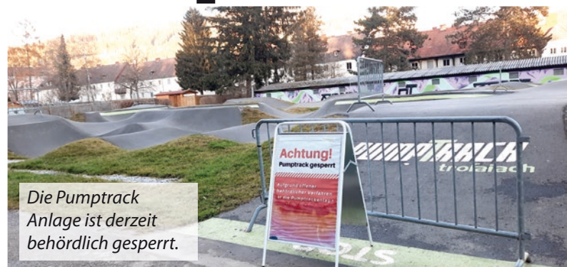
Die Pumptrack Anlage ist derzeit behördlich gesperrt.