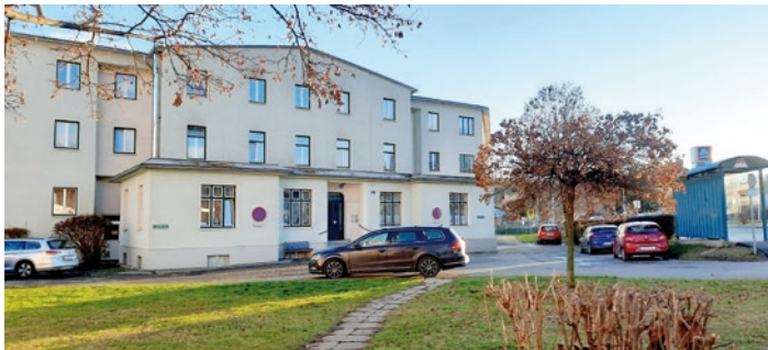
Die Mieter der Kehrgasse 41 warten immer noch auf Parkplätze.

Die zweite Tranche des Mietenzuschusses von 4.800 Euro an das Sportgeschäft „Die Sportlerei“ und die erste Tranche von 3.600 Euro an die „Entspannungspraxis Die Baumlerei“ - beide in der Luchinettgasse - wurden einstimmig beschlossen