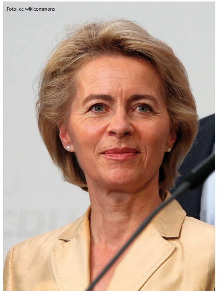
EU-Kommissionspräsidentin Ursula von der Leyen schwimmen die Felle davon