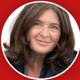
ELKE KAHR KPÖ-STADTRÄTIN